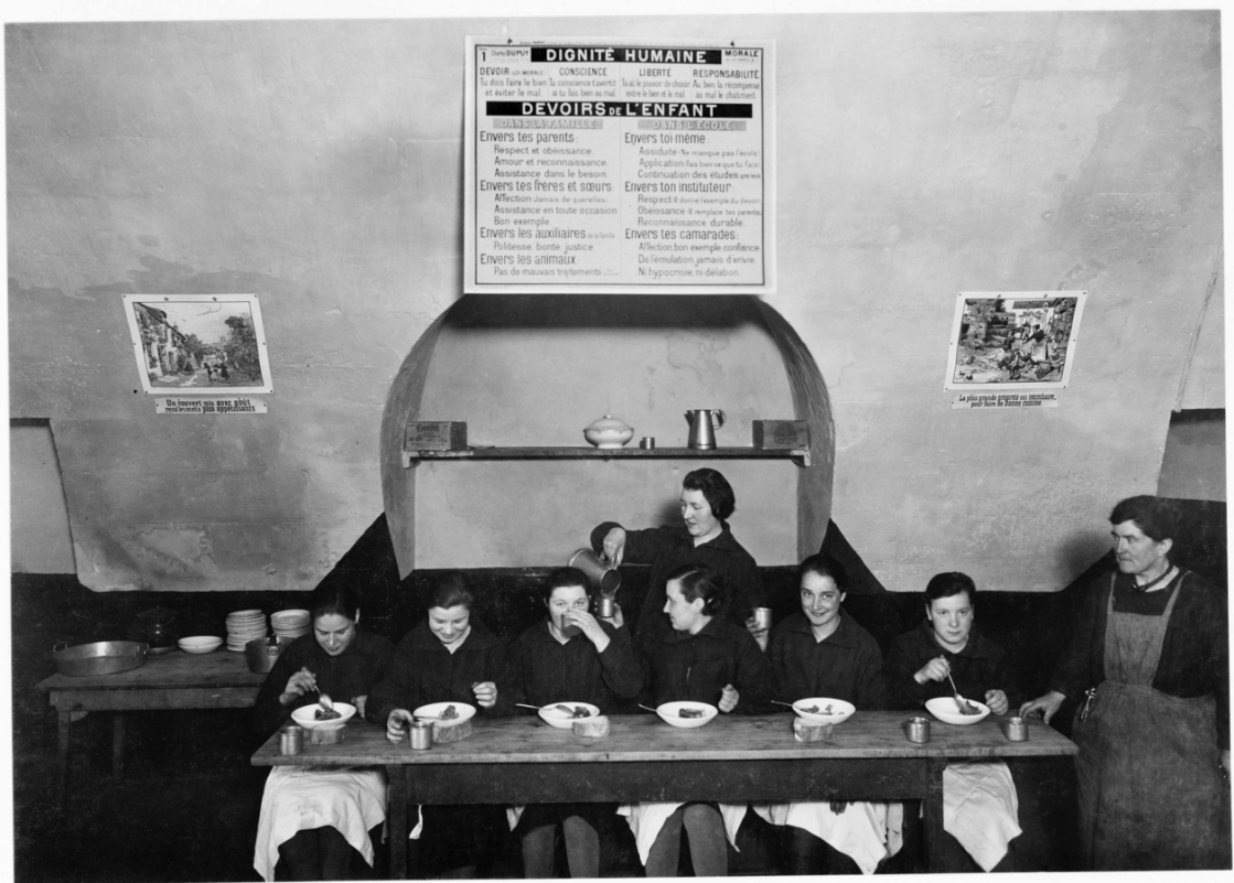
IPES de Cadillac - Réfectoire.