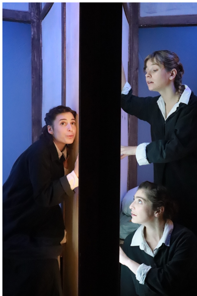
TABLEAU : désigne une scène visuelle dans laquelle il n'y pas forcément de texte.

SCÉNOGRAPHE : concepteur des décors qui choisit l'ensemble des éléments composant l'espace théâtral. Avec la mise en scène, ils/elles créent un univers en tenant compte de l'espace, du temps et des personnages. Il/elle fait un travail de documentation historique, dessine des esquisses, puis met en forme son idée en fabriquant une maquette en trois dimensions. Artiste mais aussi technicien.e, il/elle réalise les plans, choisit les matériaux puis coordonne la construction en atelier. Réaliste ou poétique, son décor doit servir la pièce et offrir différentes possibilités de jeu.