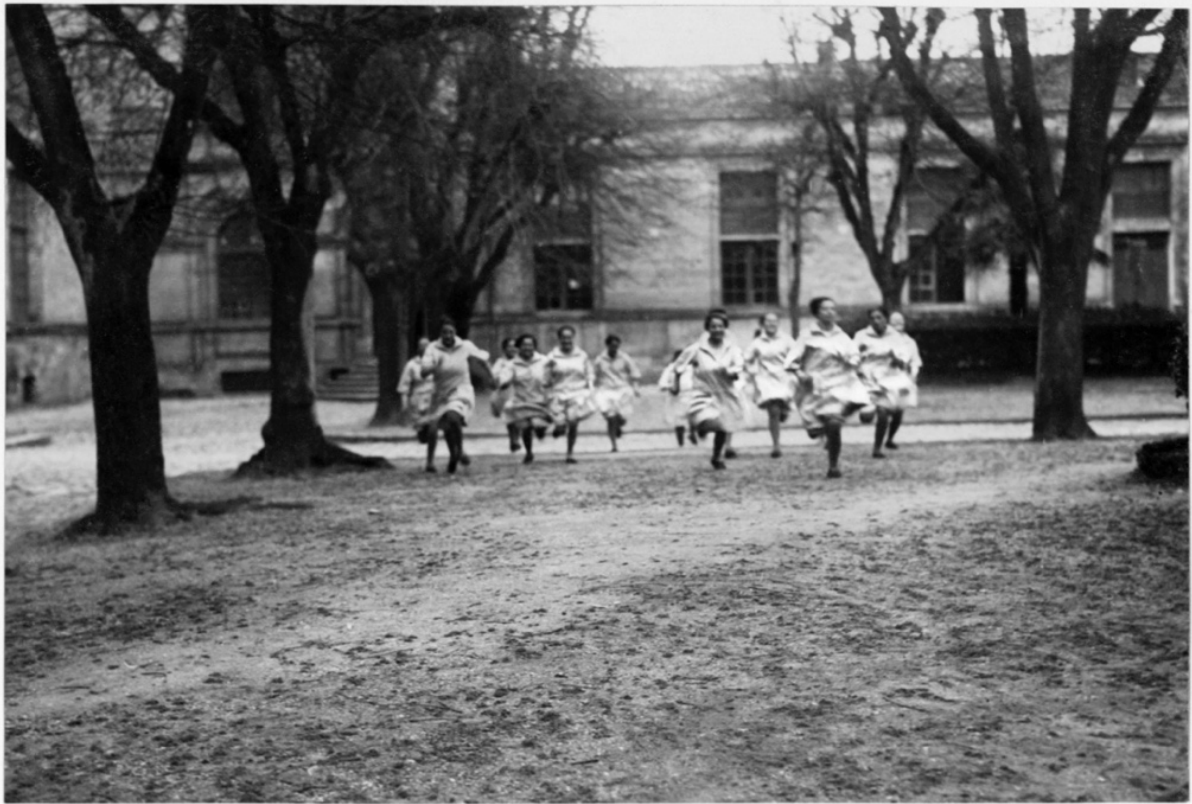
IPES de Cadillac, Extérieur.