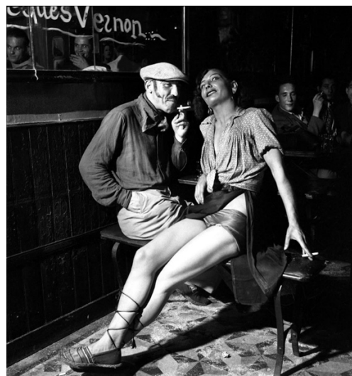
Paris dans les années 1950