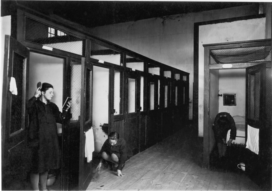
IPES de Cadillac - Chambre.