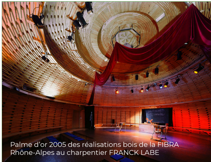
Palme d'or 2005 des réalisations bois de la FIBRA Rhône-Alpes au charpentier FRANCK LABE

Le Patadôme est un dôme réalisé en bois empilés pour proposer un espace de théâtre à configurations multiples unique au monde (frontal, circulaire...)